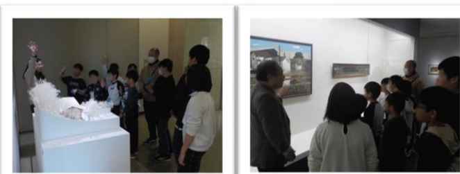
美術館鑑賞・ミニ四駆作り 姫路市立美術館友の会様