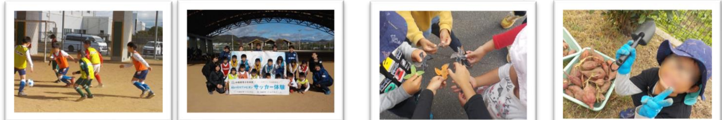
サッカー体験 ASハリマアルビオン様